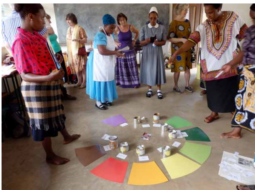
Ein Montessori-Jahreskreis entsteht in gemeinsamer Arbeit.

drei Schritten umgesetzt werden: Bauen – Bilden – Begegnen. Im Sommer 2013 konnte der Kindergarten, der sich in der von dem aus Dresden stammenden Missionar Bruno Gutmann vor 100 Jahren errichteten Kirche befindet, grundhaft saniert werden. In den beiden folgenden Jahren wurde die Ausbildung einer Kindergärtnerin an der Montessori-Fachschule in Moshi finanziert. Das Begegnungsprojekt musste langfristig vorbereitet werden und wurde in diesem Jahr umgesetzt. Im Januar führen Vertreterinnen und Vertreter von vier evangelischen Kindergärten nach Tansania. Im September kamen Vertreterinnen von sechs Kindergärten aus der Norddiözese nach Sachsen. Jeweils 14 Tage dauerte eine Projektreise. Zum Programm gehörten Seminartage, die von Gabriele Oehme, ehemalige Referentin im Diakonischen