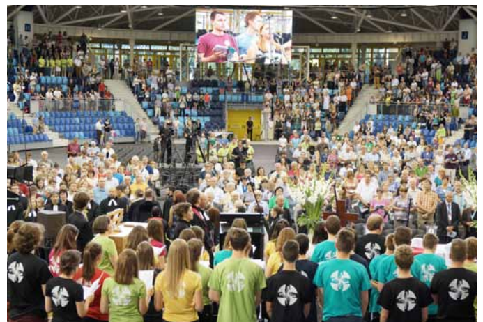
Veranstaltung in der Dornenhalle

zurechtkamen. Kirchenprominenz war zahlreich vertreten. Wir Sachsen hatten u. a. einen Programmbeitrag „Wege der Reformation“ eingebracht. Mehrere Diasporakirchen beteiligten sich mit einem kleinen schauspielerischen Beitrag über bedeutende Persönlichkeiten der Reformationszeit in ihrer Heimat. So trafen Luther und sein späterer Gegner Karlstadt vor einem Journalisten zum Interview über die Bilderstürmerei aufeinander, und eine Jugendgruppe aus den österreichischen Alpen spielte eindrucksvoll, auch in Trachten, eine Szene aus der Zeit der Bibelschmuggerei. Eine ungarische Gemeinde hatte passend zum Motto einen Salzsteuerer aus Keramik hergestellt, der, genau wie ihr Kirchturm, eine Nachbildung des Turms der Schlosskirche zu Wittenberg darstellte – ein schönes Souvenir.