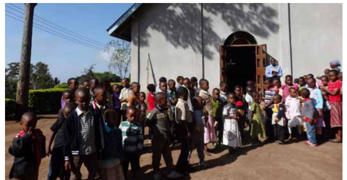
Nach dem Kindergottesdienst in Maedeni (Tansania) am Fuße des Kilimandscharo

Am 11. November 2017 wird die mittlerweile siebente Adventsaktion eröffnet. Diesmal steht wieder Tansania im Mittelpunkt der Bildungs- und Spendenkampagne. Bis zum 6. Januar 2018 sind alle Gemeinden und Einrichtungen in der Evangelisch-Lutherischen Landeskirche Sachsens und der Evangelischen Kirche in Mitteldeutschland eingeladen, sich kreativ zu beteiligen. Nähere Informationen werden ab Mai 2017 veröffentlicht.