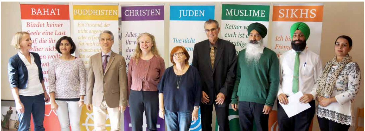
Miteinander der Religionen in Dresden

Es fehlte nicht an negativen Schlagzeilen über Dresden in den letzten Monaten. Als Ausgangspunkt der Pegida-Bewegung wird inzwischen der Name der Stadt Dresden in vielen Teilen der Welt mit dumpfem Ausländerhass und Überfremdungsangst verbunden. Dass manche Demonstrationsteilnehmer persönlich andere Motive haben, ändert daran nichts. Was wahrgenommen wird, sind die Parolen, die von der Bühne und in den sozialen Medien verbreitet werden.