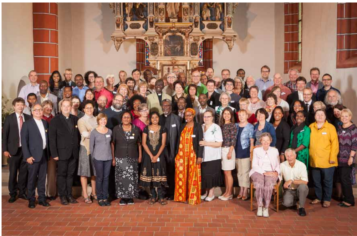
Die Teilnehmenden der internationalen Partnerschaftstagung in der St. Afra Kirche Meißen